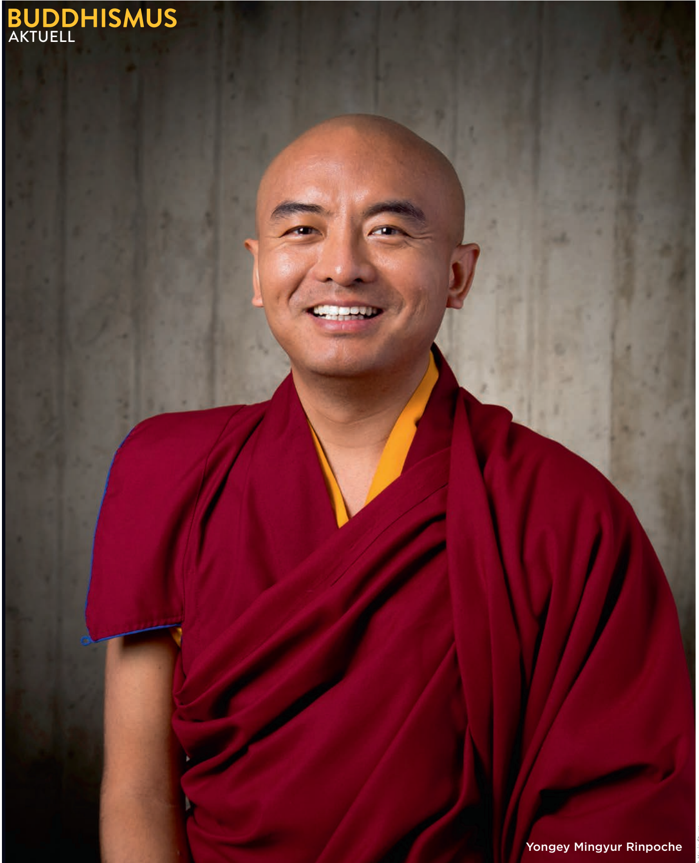
Yongey Mingyur Rinpoche