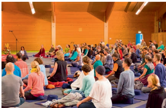
Retreat in Winterberg 2017

Yongey Mingyur Rinpoche, ein bekannter Meditationsmeister mit langer Tradition und zugleich Vertreter des modernen tibetischen Buddhismus, verfügt über die seltene Fähigkeit, auch komplexe Inhalte einfach und direkt zu vermitteln. Seine detaillierten Beschreibungen der Vorgänge in unserem Geist ermöglichen AnfängerInnen einen leichten und spielerischen Zugang zur Meditation sowie vielen erfahrenen Meditierenden die Möglichkeit, Bekanntes ganz neu zu entdecken und dann in einer frischen Sichtweise zu praktizieren.